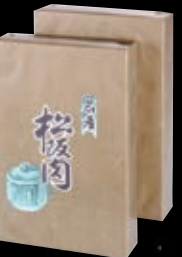
1箱のサイズ:約横25.5cm× 縦16.5cm×高さ4.5cm

「頭一頭手塩にかけて育てられた松阪牛。 きめ細かな上質の霜降りが入ったお肉は「肉の芸術品」。 口の中でとろけて広がる脂肪と旨味のある赤身の 絶妙なバランス。これこそが松阪牛の醍醐味です。