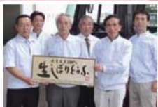
マルツネの工場のみなさん