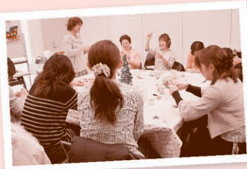
「スマイル」委員会、前回マカロン型小物入れ づくりの様子

※応募多数の場合、抽選となります。 当落結果は5/7(火)~八ガキで お知らせします