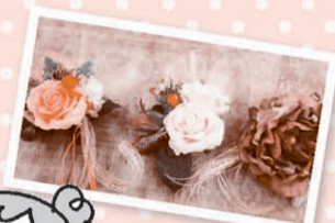
サークル活動の中で作った手芸作品