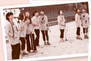
※写真は昨年のお様子