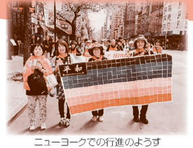
ニューヨークでの行進の様子