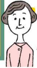
22年6月 川柳キャンペーン 投稿より