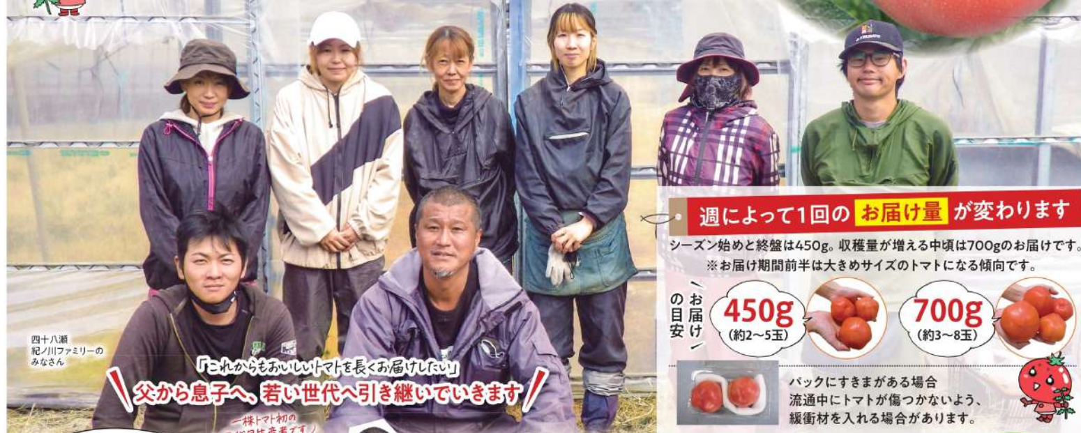
四十八歳 紀ノ川ファミリーのみなさん

「本当においしくて安心できるトマトを作りたい」という生産者さんと組合員さんをつなぐ「一株トマト」。長く愛され続けている、この季節だけのトマトです。