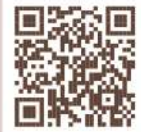
総代の体験を動画にしました。