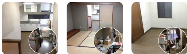
ご家族に代わって、必要な物、処分する物を丁寧に精査します

お困りではありませんか? 仏壇や、写真、手紙、人形など故人の思い出の強い品などは、ご供養してから処分したり、遺品ひとつひとつを粗末に扱わず、故人を思い、偲び、適正に処置させていただきます。