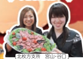
北枝方支所 宮山・谷口