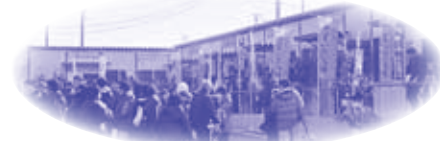
ゆりあけ 関上さいかい市場(宮城県名取市)