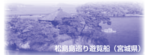
松島島巡り遊覧船(宮城県)