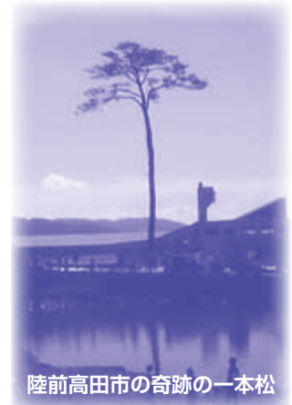
陸前高田市の奇跡の一本松