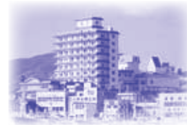
ホテル観洋(宮城県気仙沼)