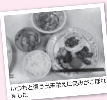
いつもと違う出来栄に笑みがこぼれました

近、お弁当を作る家庭が増えたためか、応募者が多く抽選を行って31名の方が参加されました。行政区委員の方もお弁当づくりの経験を活かして、各自「お薦め!お弁当のおかずと作り方」を紹介しました。「冷凍のデザート食品以外にも、ボール状の一口チーズを凍らして入れておくと、保冷剤がわりになりますよ!」冷凍オクラスライスも、冷凍のままかつお節と醤油をかけて入れておくと保冷にもなるし、これからの暑い時期にはいいですよ!」など、これからの季節に心配される食中毒を防ぐためのアイデアに、一同感心しながらメモをとります。