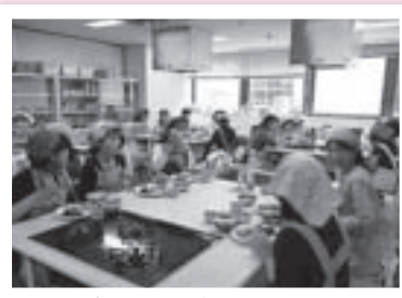
各テーブルから家でもやってみようという声

み〜るクラブはお料理だけではなく、くらしをテーマにいろんな体験ができる場となっています。み〜るクラブは組合員であれば、誰でも登録ができます。ご希望の方は 組織部 06-6319-5619 までお問い合わせください。