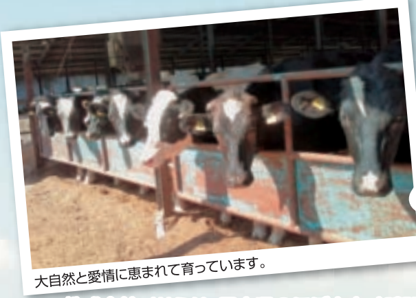
大自然と愛情に恵まれて育っています。