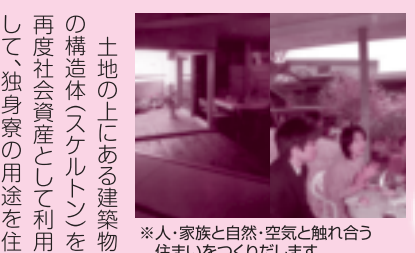
※人・家族と自然、空気に触れ合う住まいをつくりたいです。

コーポラティブ 今回は、次代の家づくりで注目を集めているコーポラティブ住宅の計画をしています。