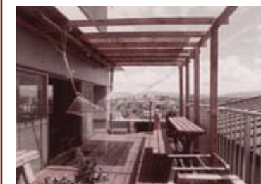
デッキに広がる暮らしイメージ写真

普通のマンションでは考えられない 楽しい仕掛けがいっぱいです 既存の建物(元独身寮)を利用することでコストダウンを実現した、コンバージョン式のコーポラティブハウス。ライフスタイルや予算にあわせて自由に設計ができます。眺望のよい高台を見渡す、広々デッキにつながる開放的な住戸。豊かな暮らしを低価格で取得ができます。既存壁・家具を自分らしくアレンジしたりと自分らしい暮らしづくりを楽しみませんか?