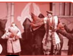
6月3回 チラシにてご案内

日程 7月29日(金) 正面開場10時~ 場所 国立文楽劇場 (大阪市中央区日本橋1-12-10) 参加対象 4歳以上(託児なし)