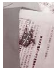
この後、5月末までに2名が入替わりで、いわて生協の契約組合員の訪問支援を行いました。

「よどがわ」からも4月19日より宮城県石巻市の訪問活動に1名が参加しました。手続きの用紙をいれた封筒には、全国の組合員から寄せられた折り鶴が添えられています。一人ひとり地図を見ながら訪問する中、東北言葉ではなくても、生協の職員や共済の職員というところで受け入れていただきました。訪問の中では、津波の被害を受けた生協のお店の心配と、再開を望む声もたくさんいただきました。日頃、配達担当者やお店を通じて生協が信頼されていることを強く感じました。