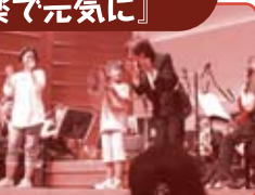
6月4回 チラシにてご案内

日程 第一回公演 開場10時15分~ 8月10日(水) 第二回公演 開場13時45分~ 場所 NHK大阪ホール (大阪市中央区大手前4-1-20) 参加対象 4歳以上(託児なし)