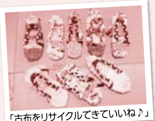
「古布をリサイクルできていいね!」

今回は摂津市立コミュニティプラザにて初めて開催し、組合員以外の地域の方も参加してくださいました。『布ぞうり』づくりを体験しながら、よどがわ生協や『ほのぼの』を知っていただき、地域での交流を深めました。