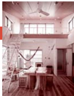
ロフト空間イメージ