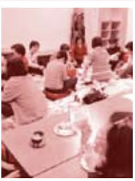
会員以外の方もたくさん!

くらしの助け合いの会『ほのぼの』では、毎年『ほのぼのサロン』を開催しています。組合員・ほのぼのの会員を問わず参加できる催しで、手芸などをしながら、楽しくおしゃべりしたり、お茶をしたり、地域の方に『ほのぼの』の活動を知っていただく場としています。