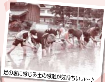
足の裏に感じる土の感触が気持ちいい〜♪