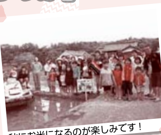
秋にお米になるのが楽しみです!

水のいった田んぼにそれぞれ入る度に「ひゃ〜♪ 気持ちいい!」「うわ〜なんて柔らかいんだろう」と、 驚きと楽しい声があがりました。減農薬だからこそ、 オタマジャクシやアメンボなど生き物との出会いが あり、お子さんから歓声があがり、お父さん・お母さん はその姿をほほえましく見守っていました。ひと仕事 したあとの昼食は格別でした。日野町の農家さんお手製のおにぎりや具だくさんの トン汁をおいしくモリモリ食べ、木の臼で餅つきも体験しました。また日野町特産の 日野菜の収穫もできて、田んぼだけでなく畑で食物を育てる喜びも学びました。