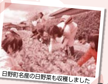
日野町名産の日野菜も収穫しました