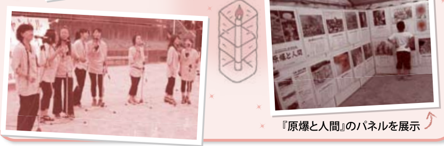
『原爆と人間』のパネルを展示