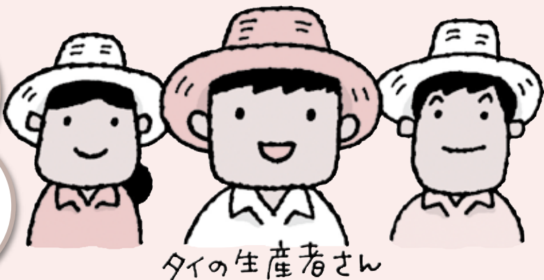
タイの生産者さん