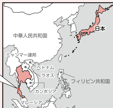
【産地タイ】 トゥンカーワット農園経営農民会 (タイ、チュンボン県ラーメー郡)