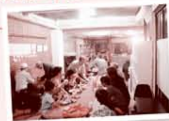
子ども食堂のようす

在庫商品の内、今まで各支所で廃棄していた商品の在庫を本部に集めて一括管理し(生鮮食品は除く)、フードバンクや子ども食堂への活用により、一般廃棄物の削減につなげることができました。