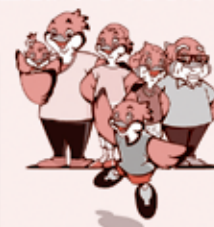
大阪府広報担当副知事 ますやんと家族

下水道や合併浄化槽等を利用していても、これらの取組は、処理施設への負担を減らすためにも有効です。