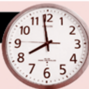
本部3階の止まった時計