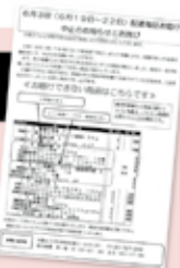
商品欠品のお詫びチラシ