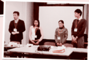
バナナの生産者学習交流会