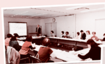
昨年の秋の総代懇談会