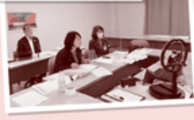
リモートのようす

「総代」にご興味のある組合員さんは、毎年1月中旬頃に「総代選挙公示」を商品カタログと共に配布していますので、ご覧ください!