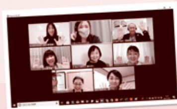
オンライン会場のような様子

今回いただいたご意見をもとに、生協の事業・活動のすすめ方などをまとめ、年度末総代懇談会でご報告し、次年度の方針づくりをすすめます。