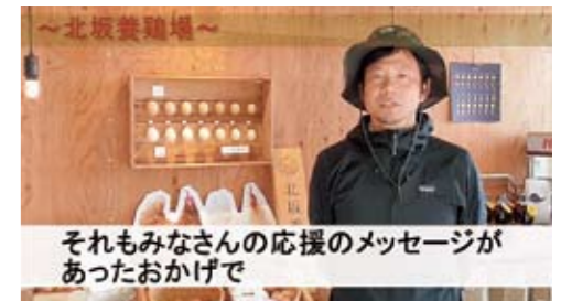
それみなさんの応援のメッセージがあったおかげで

ロングセラーのさくらたまごは、みなさんの声援を力に復活。これまで以上に生産体制を整え、これからも新鮮なたまごを淡路島からお届けします。