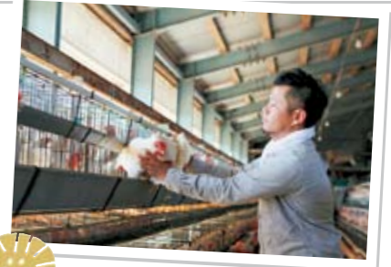
北坂養鶏場「さくらたまご」の特長