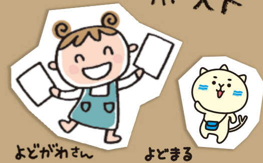
よどがわさん よどまる