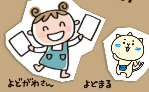
よどがねさん よどまる

みなさん、どうして過ぐられちゃうのかな? コロナ禍で買い物に行くのが不安だったので、食品、もちろん日用品他すっかりコープさんにお世話になりました。解除になっても今はお出かけがおつくりになつてしまい、生活スタイルがすっかりひきこもり状態のまま。不要不急以外に出かけなくたって...自分を少し解放するにも勇気がいります。皆さんどう過ぐされていきますか? 教えて!