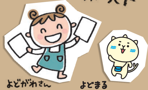
よどがねさん よどまる