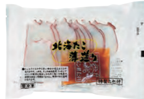
(豊中市 ころりんさん)