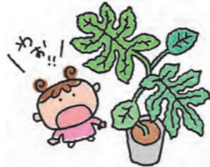
(西淀川区 抹茶アイスさん)