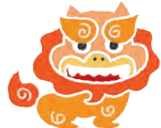
(吹田市 ゆいれーるにのりさん)