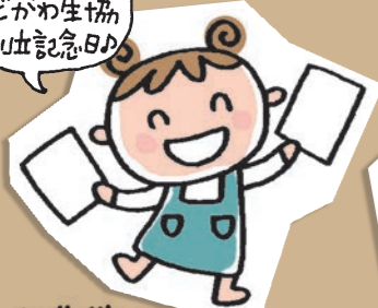
よどがわさん よどまる