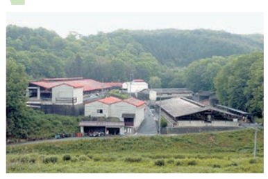
イサミ吉備高原牧場