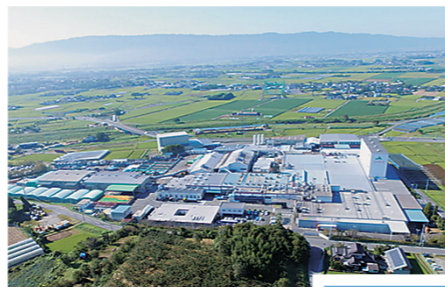
福岡県朝倉市の株式会社ふくれん「甘木工場」。広大な工場敷地内には複数の「深井戸水」があります。

福岡県中央部、美しい川と豊かな山林に囲まれた田園地帯の朝倉市。国土交通省が定める「水の郷百選」にも選ばれる『甘木の水』を使っています。井戸水には「浅井戸水」と「深井戸水」がありますが、ふくれんでは、岩盤層を超えて掘り下げた井戸から採水する「深井戸水」を使っています。