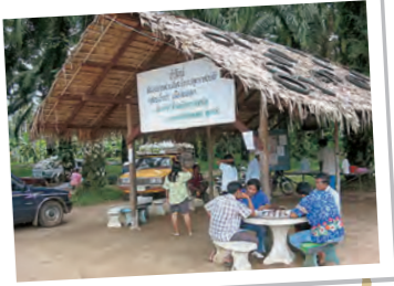
憩いの場にもなっているバナナの出荷作業所

よどがわ市民生協の登録バナナは、顔の見える生産者のみなさんが栽培しているこだわりの商品です。生産者との交流は30年間続いています。先日も組合長が代表で来日され配送で組合員さんと交流しましたよ!栽培時に無農薬で育てているバナナ、安全・安心に食べることができます。