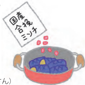
(高槻市 ズンコさん)