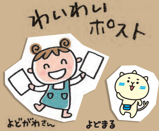
よどがねさん よどまる