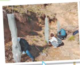
鹿に食べられないようにネットを設置しました。

台風21号の影響で、植林していた杉がなぎ倒されてしまった山に『山桜』を植樹しました。山桜は約5年で花が咲くそうです。近い将来山桜が咲き誇る山々になることを願っています。大阪府森林組合はこれからも市民とともに森林の育成を続ける予定です。