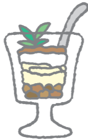
(東淀川区 ピリピリさん)