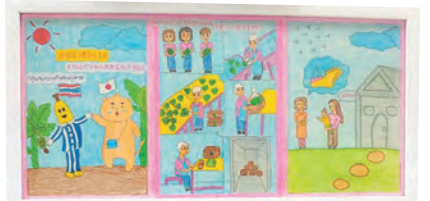
来日時、生産者から絵のプレゼントが!