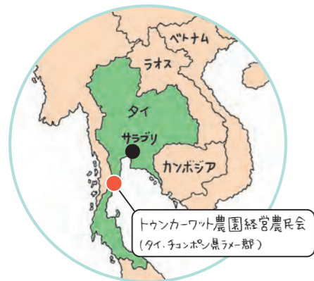
トウカンカーワット農園経営農民会 (タイ、チョンホーン県ラマー郡)

開発当時、SDGsという言葉もなく、ポストハーベストなる中、「子どもたちに安全・安心なバナナを食べさせたい」の抑制や作物の多様性の保全、タイのバナナ農家次世代