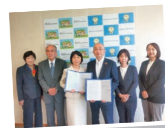
島本町 社会福祉協議会と

今後は災害時に限らず、日常から相談しやすい関係づくりを目的に情報交換などを定期的に行います。