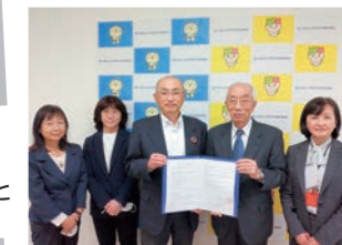
池田市 社会福祉協議会と