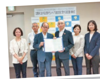
摂津市 社会福祉協議会と