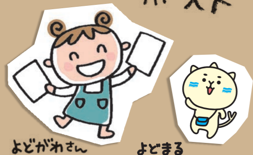
よどがねさん よどまる