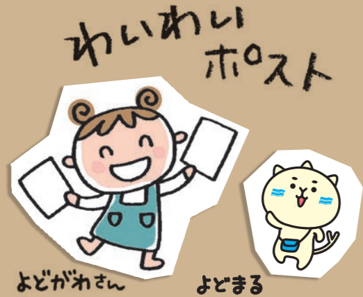
よどがねさん よどまる