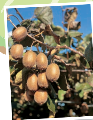
たわわに実った今年のキウイフルーツ。光をたっぷり浴び、元気に育ちました