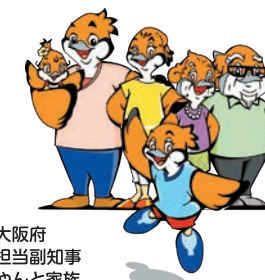
大阪府 広報担当副知事 ますやんと家族

下水道や合併処理浄化槽などを利用していても、これらの取り組みは、処理施設への負担を減らすためにも有効です。