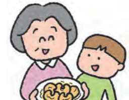
(吹田市 あーちゃんさん)

かわいい孫との交流♡ 小学1年生の孫が「エビマヨ作って」とリクエストがあると、生協で購入したノースイさんの冷凍『お手軽調理で簡単海老マヨ』を注文しています。フライパンで海老を炒め、エビマヨソースかけて容器に入れて届けます。いつもおいしいと…。私が作るというか生協なんですけどね。子どもはマヨネーズが好きなので喜びます。学童保育中のおやつでも、生協のがでるらしく、私が生協で注文したおやつを届けると、「これ学童のおやつで食べたよ〜」と、これおいしいねと孫と話はずみです♪