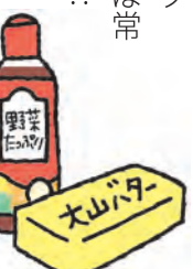
(東淀川区 みりママさん)

大山乳業さんの『大山バター』がとてもおいしく、このバターで作ったフレンチトーストやホイール蒸しなど、できあがりの味がぜんぜん違います。子どもたちも別のバターを使うと、「今日の味、いつもと違う!!」とすぐに気づくくらいです。少し値段は高めですが、さっぱりとした風味のいいのが特徴です。ドレッシングは生協と決めています。フンドーキン醤油さんの『コープ 野菜たっぷり和風ドレッシング』や、『コープ 深入り胡麻ドレッシング』は常にストックしていますよ!!