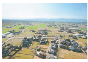
共同利用の農産物施設を有するJAいなば

富山県の西端にあり、“北アルプス”と呼ばれる立山連峰などの山々に囲まれるJAいなば。北西から南西にかけては中山間地であり、標高346mの稲葉山からなだらかな丘陵が連なります。小矢部川が平野を貫いて流れ、田んぼの中に民家が散らばるのどかな散居村(さんきょそん)が広がります。暑い夏場でも山々からの冷たい水を水田に流し込むことができる、米作りに適した肥沃地です。JAいなばが支える水田の面積は、東京ドーム約960個ぶんの4,458ヘクタールにおよびます。