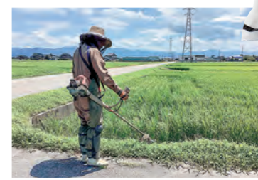
こまめな草刈りは、農薬を減らすうえでも欠かせません