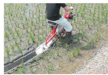
田んぼに溝を切り、排水口につなげる「溝掘り作業」。健康な稲を育てるため、水の通路をつくります