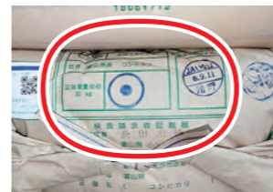
米袋に記載されている『一等米』のマーク