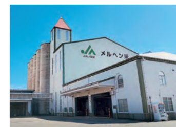
刈り取った籾(もみ)が集まるカントリーエレベーター。生きたままの籾の状態での低温貯蔵し、注文を受けた分だけ籾摺(もみす)りをして出荷します