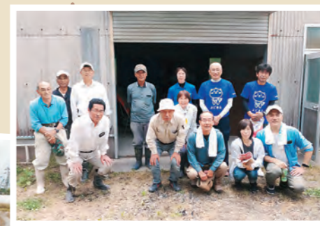
畑の中は水たまりもあり、長ぐつは必須です

前日までの雨でぬかるんだ畑の中、大豆の植え付け作業を行いました。特殊な筒状の道具を使い、大豆を2粒ずつ投入する作業です。できるときに、『できる人が、できるところまで』と、気軽に自然や農業に触れる体験として、今後の活動に活かし、広げていきたいと思っています。