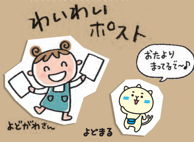
よどがねさん よどまる