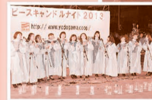
ゴスペルコンサート