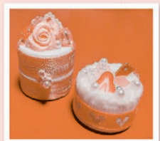
ペットボトルキャップ小物入れ

※応募多数の場合、抽選となります。当落結果は3/18(火)~ハガキでお知らせいたします。