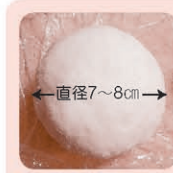
バスボム ※写真はイメージです