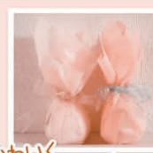
かわいくラッピング