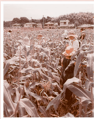
バスツアー(とうもろこし狩り)