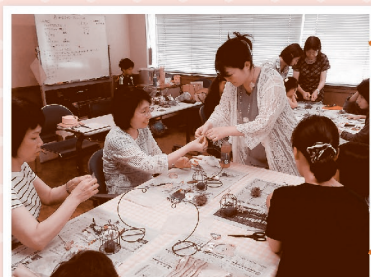
季節の小物作品づくり