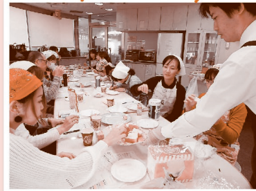
パンの学習会(異製粉)