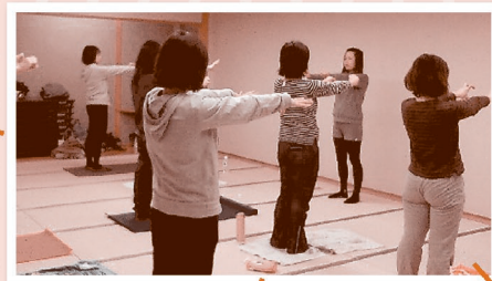
ピラティス・ヨガ