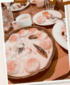
カフェでランチをしました♪