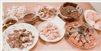
生協商品で料理をみんなで作りました!

よどがわ生協ホームページにて、コープ委員会についてご案内しています。ぜひ、のぞいてみてください♪