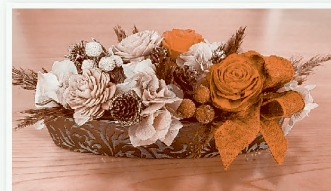
作品サイズは 横20cm×幅8cm×高さ12cm