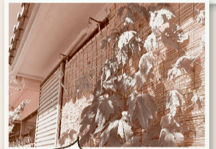
グングン伸びたよ!