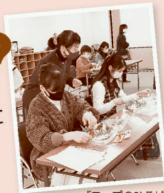
「コープのひろば」のようす

同じ地域(行政の市・区・町が同じ)に居住する組合員4人から始められます! 生協の商品や子育てなど、くらしの関心事をみんなで話したり、各コープ委員会で『コープのひろば』を開催し、参加する組合員さんを募集しています!