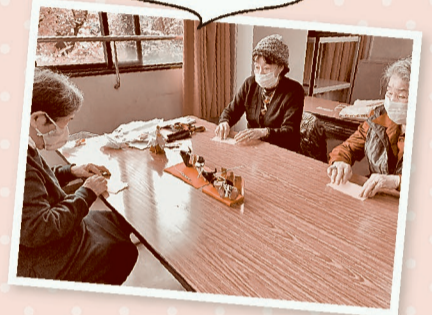
高槻・はにたんコープ委員会

新型コロナ禍の中、生協の新規組合員さんも増えています。「子どもといっしょの買い物が難しくて、重い物だけでも届けてもらっています。」「健康のために散歩はするけど、人がたくさんの中の買い物がちょっと心配で...時短で済ませています。その分、カタログをじっくり見ながら選べる生協で、買い物を楽しんでいます。」などの声が、よどがわ市民生協へ寄せられています。